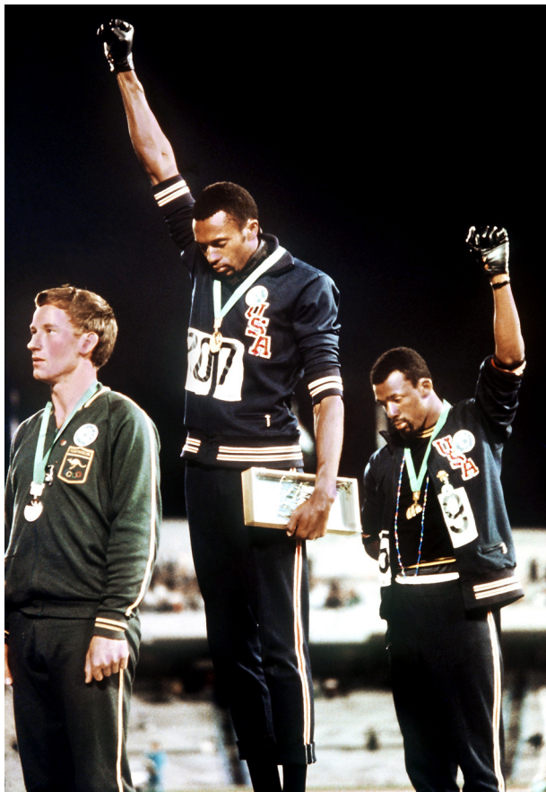
Figura 1. Tommie Smith, Peter Norman y John Carlos, 16 de octubre de 1968.

Pero el momento culminante tuvo lugar en el siempre patricio Club Atlético de Nueva York. Este resumía plenamente los motivos de la iracundia del atleta afroamericano, los puntos vulnerables del sistema deportivo estadounidense y las perplejidades en que desembocaba la protesta de atletas de alto rendimiento en un ambiente preolímpico. En tanto organización privada, la membresía del Club Atlético de Nueva York estaba reservada solo para socios blancos; pero teniendo como nodo sus encuentros atléticos anuales –un acontecimiento mediático y deportivo en EE. UU.–había tejido una amplia trama de relaciones con escuelas y universidades que proveían un buen número de atletas negros para los encuentros de pista y campo.