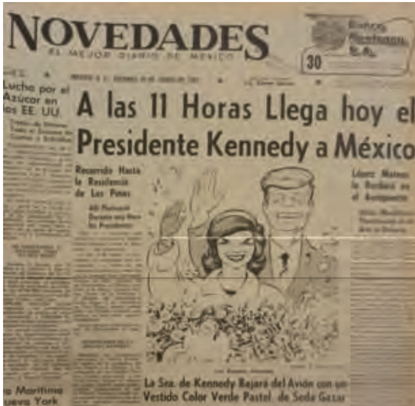
Figura 33. "A las 11 horas llega hoy el presidente Kennedy a México", Novedades , 29 de junio de 1962, p. 1.

tuación de los trabajadores mexicanos y la necesidad de atraer a las maquiladoras estadounidenses.