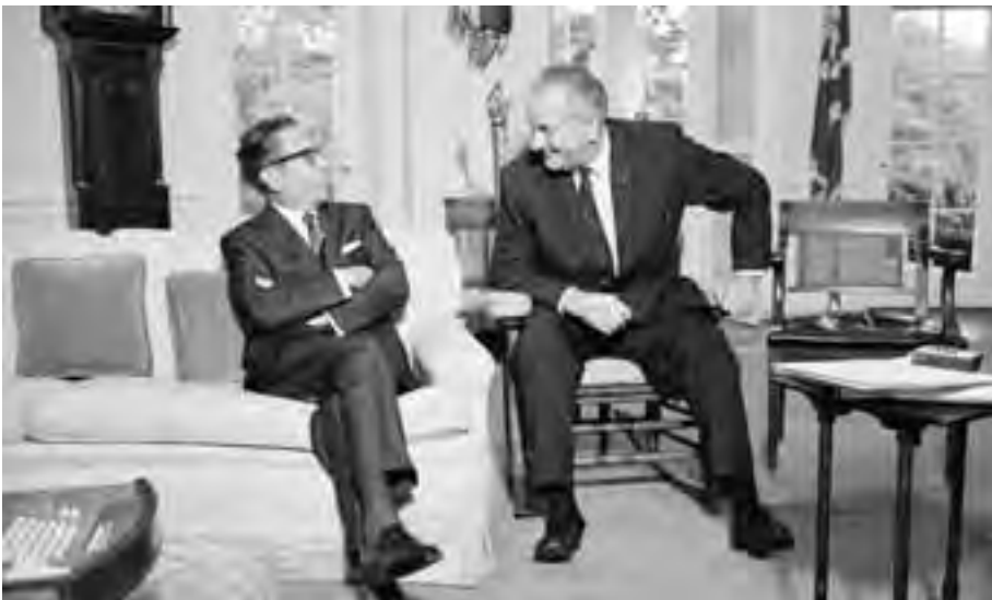
Figura 35. El presidente Díaz Ordaz con el presidente Johnson en la Casa Blanca, el 26 de octubre de 1967. ID: U1572193 © Bettmann/Corbis Images.