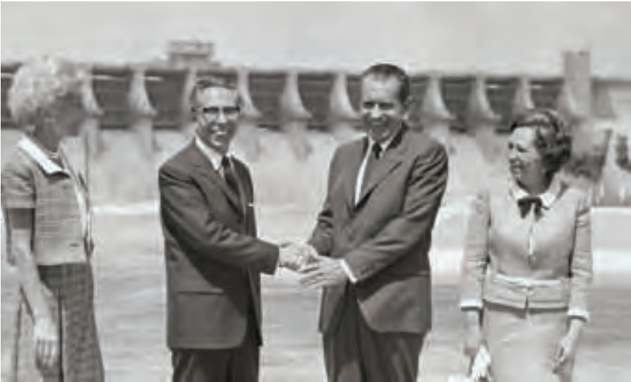
Figura 36. El presidente Díaz Ordaz y el presidente Nixon estrechándose las manos en una ceremonia en el lado mexicano del río Grande, después de la inauguración de la Presa de la Amistad que aparece detrás, 8 de septiembre de 1969. ID: U1643747

mo el fin de la relación especial entre México y Estados Unidos. 73 Aunque la operación fracasa y los primeros en protestar son los empresarios estadounidenses, su gobierno busca presionar al mexicano con el objetivo de que éste haga un mayor esfuerzo en cuanto a la destrucción de cultivos e impida el cruce de las drogas en la frontera.