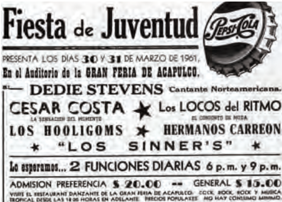
Figura 31. Cartel de anuncio Fiesta de Juventud. Colección particular de los Hermanos Carrión con Diego Cossio.

bilingües se difunden programas de intercambio estudiantil entre ambos países, patrocinados por ellas mismas u organizaciones como el Experimento de Convivencia Internacional. 32 Esos programas forman parte de la tupida red de relaciones entre grupos sociales con acceso a los recursos económicos, culturales y lingüísticos, los cuales posibilitan lazos personales, escasamente estudiados.