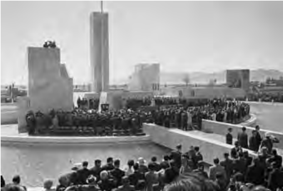
Figura 34. Foto de la devolución del Chamizal con los presidentes Lyndon B. Johnson de Estados Unidos y Gustavo Díaz Ordaz de México, el 28 de octubre de 1967. ID: U1572502