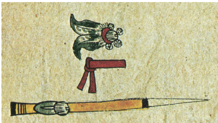
Lámina 9. “Parafernalia del cazador”, Códice Borbónico , lámina 34