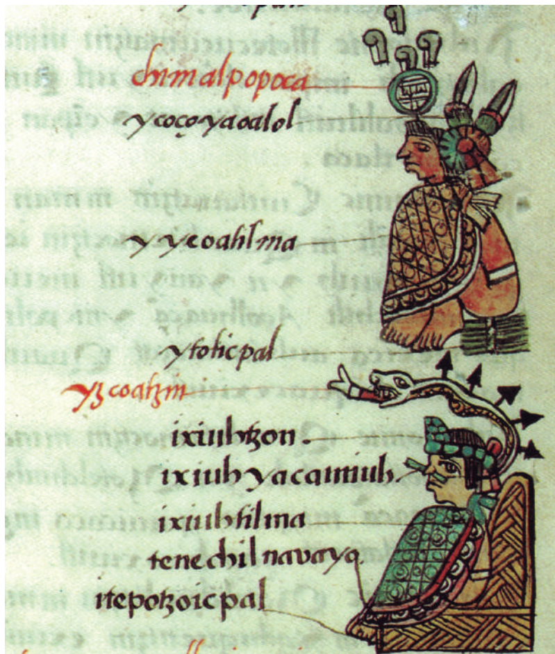
Lámina 8. “Cambio de parafernalia”, Códice Matritense , fol. 51r