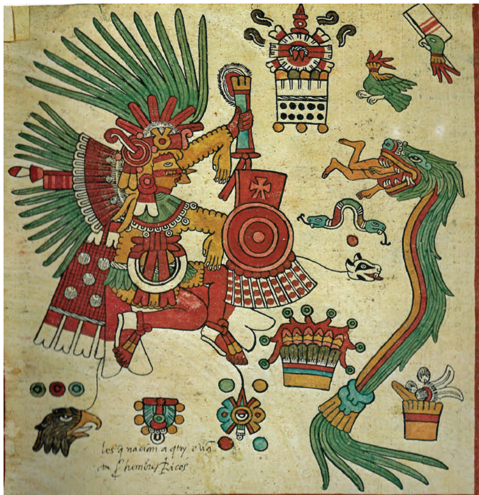
Lámina 12. "Xipe Tótec". Códice Borbónico , lámina 14