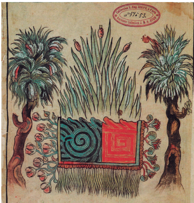
Lámina 4. Agua/fuego. Historia tolteca chichimeca , f. 16v