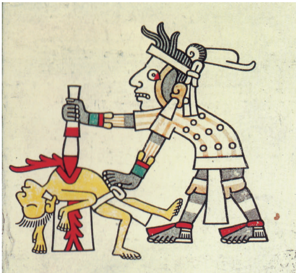
Lámina 1. La muerte sacrificial, Códice Laud , lámina 17