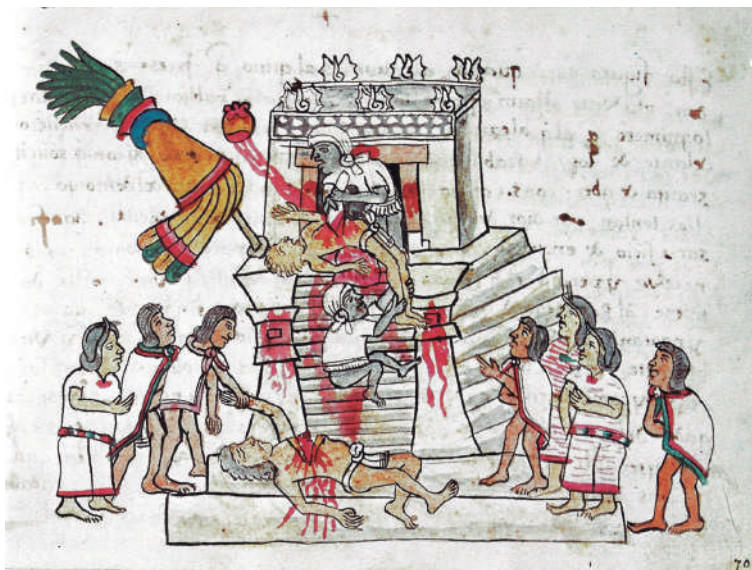
Lámina 3. Iconografía colonial del sacrificio humano, Códice magliabechiano , lámina 70r