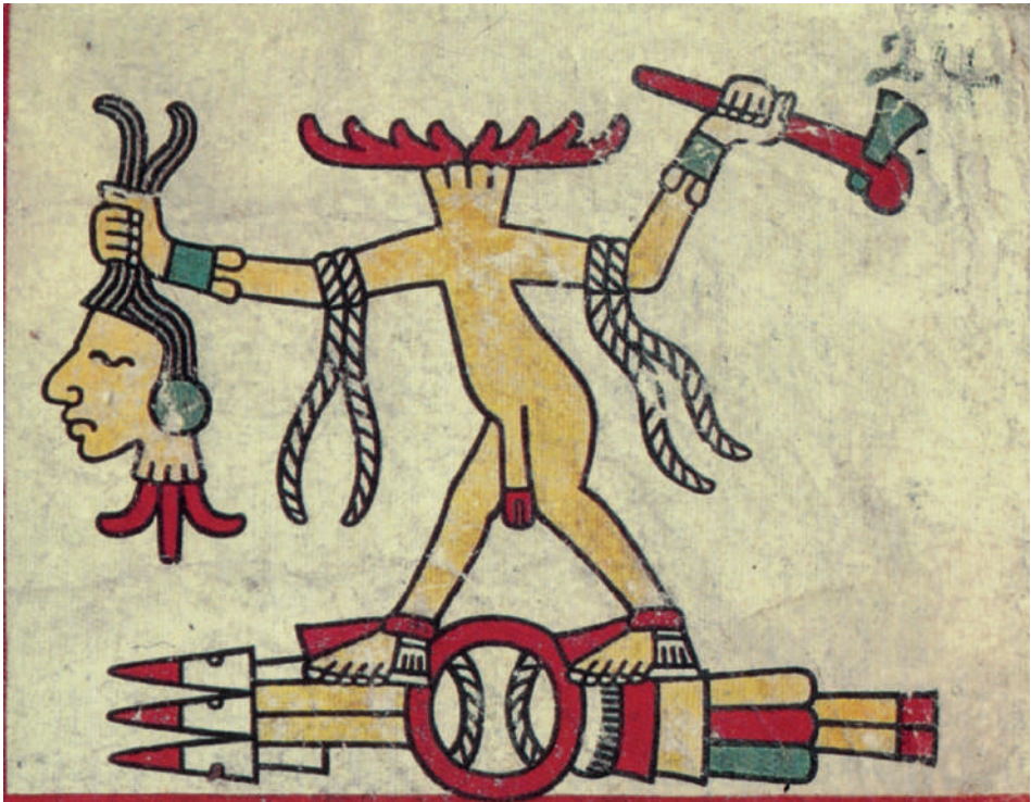
Lámina 10. “Cuello cercenado y sexo circunciso”. Códice Laud , lámina 1