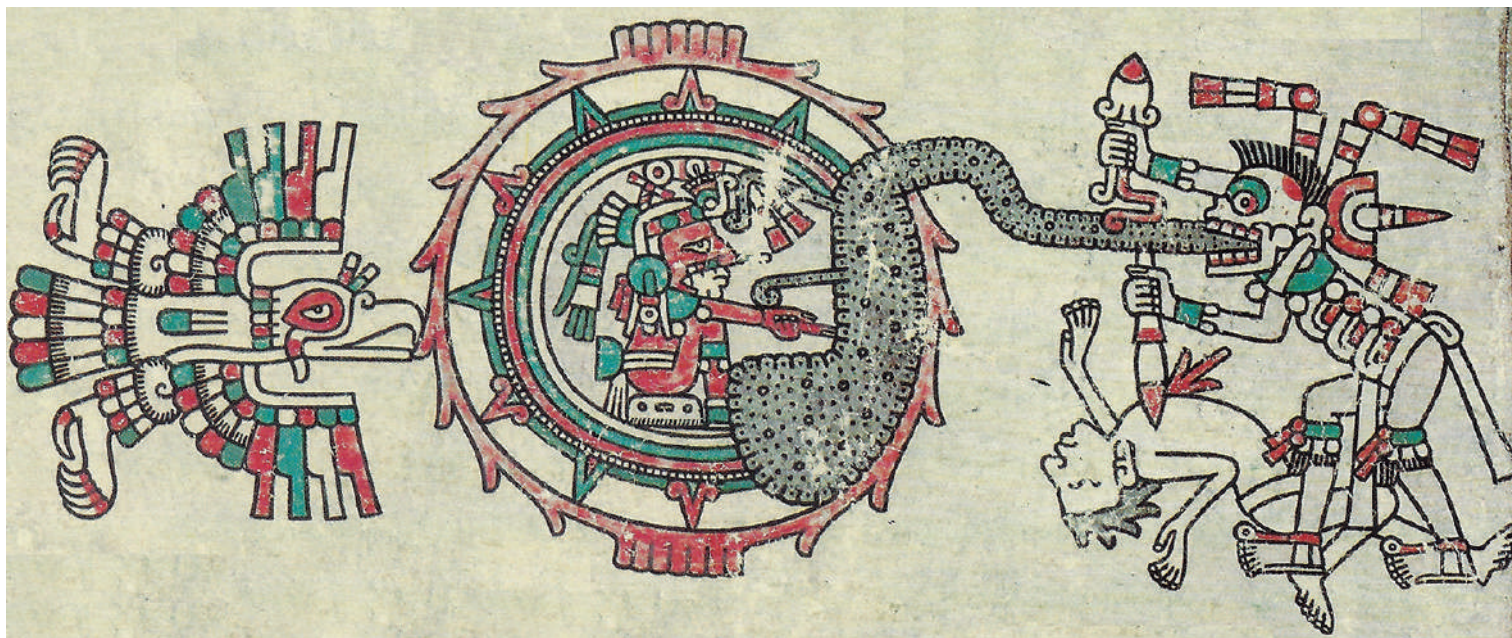
Lámina 2. Iconografía prehispánica del sacrificio humano, Códice Laud , lámina 24