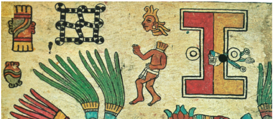
Lámina 11. “Decapitación en el juego de pelota”. Códice Borbónico , lámina 19 2023. Universidad Nacional Autónoma de México, Instituto de Investigaciones Históricas http://www.historicas.unam.mx/publicaciones/publicadigital/libros/781a/xochimiquitzli.html