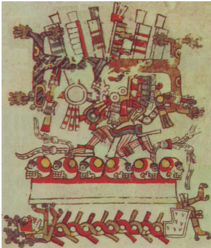
Lámina 6. Amarillo y rojo: una metonimia cromática. Códice Borgia , lámina 45 2023. Universidad Nacional Autónoma de México, Instituto de Investigaciones Históricas http://www.historicas.unam.mx/publicaciones/publicadigital/libros/781a/xochimiquitzli.html