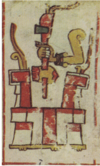
Lámina 5. El corazón. Códice Borgia , lámina 5