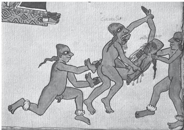
Figura 17.6. Códice Tudela , lám. 75