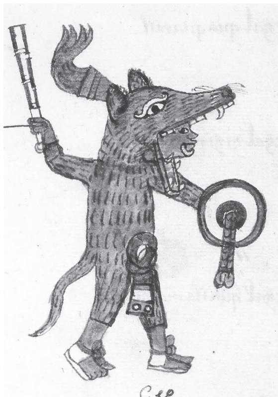
Figura 17.7. Códice matritense , f. 73r.

pelicamati in iooalli, in tlacocomo- con la dulzura de la noche, el es- tzaliztli, in icahuaquiliztli. 34 trépito y el rumor [de la batalla].