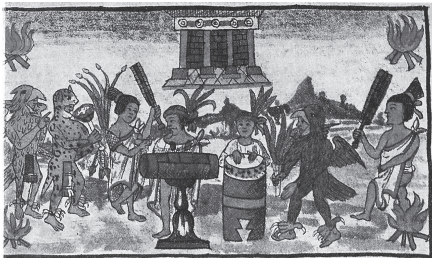
Figura 17.8. Códice Durán , t. II, lám. 39