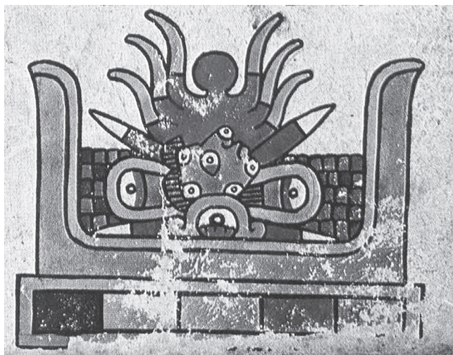
Figura 17.4. Códice Vindobonensis, lám. 6

de regeneración, al igual que el fuego, con el cual se une en las bebidas embriagantes: “realizada la ofrenda, los cantores toman sus atambores y comienzan a ‘cantar cantares de luto y de la suciedad que el luto y las lágrimas traen consigo’”. 23