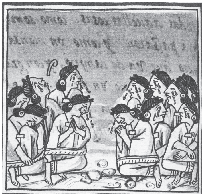
Figura 17.1. Choquiztli , el llanto. Códice florentino , lib. I, f. 32v.