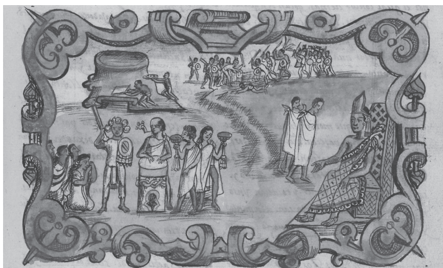
Figura 17.2. Exequias de los guerreros mexicas caídos en Michoacán. Códice Durán , t. II, lám. 25