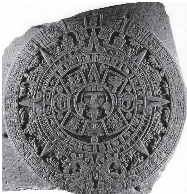
Figura 2.9. Las serpientes del tiempo en la Piedra del Sol. Museo Nacional de Antropología