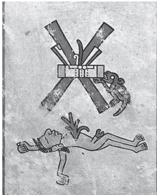
Figura 2.4. Eros y tanatos. Códice Fejérváry-Mayer , lám. II