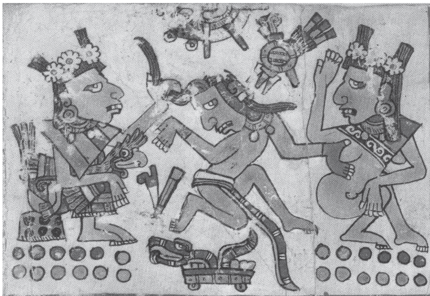
Figura 2.8. El sexo masculino como serpiente. Códice Borgia , lám. 59

varias serpientes entrelazadas manifiestan una dimensión inextricablemente esencial mas no evidente, como en el caso de la falda de Coatlicue.