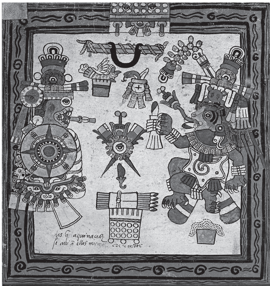
Figura 2.2. El sol viejo devorado por la tierra.