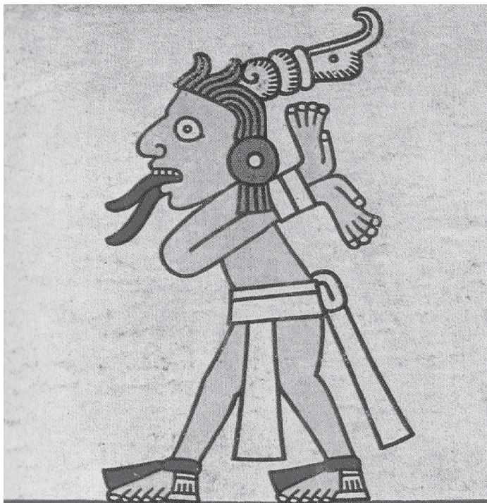
Figura 2.7. El placer por el dolor infligido a una víctima. Códice Laud , lám. 5

tiempo que los arrojaban alzábase, un gran polvo de ceniza, y cada uno a donde caía allí se hacía un grande hoyo en el fuego, porque todo era brasa y rescoldo, y allí en el fuego comenzaba a dar vuelcos y a hacer bascas el triste del cautivo; comenzaba a rechinar el cuerpo como cuando asan algún animal, y levantábanse vejigas por todas partes del cuerpo; y estando en esta agonía sacábanle con unos garabatos, arrastrando, los sátropas que llamaban quaquacuiltin . 18