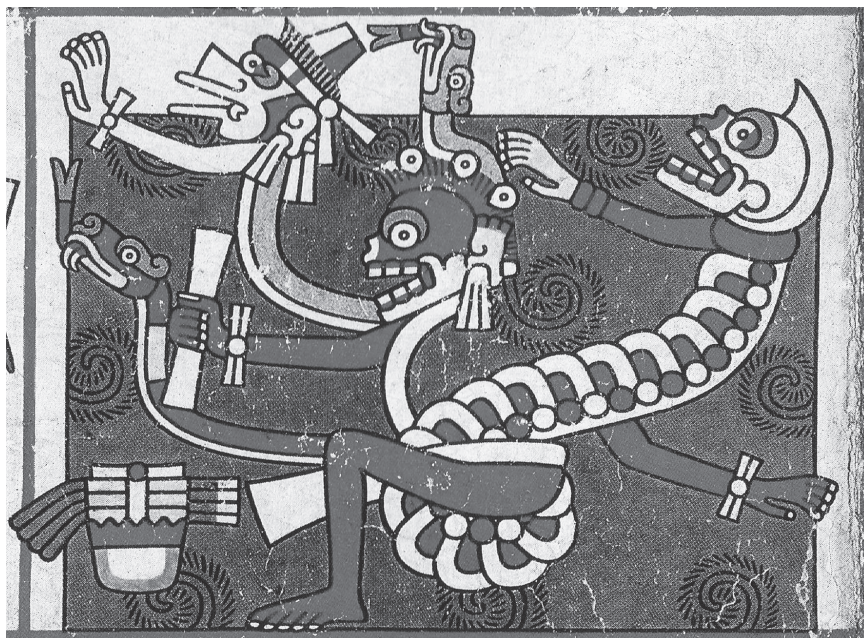
Figura 2.6. Sexo y muerte en el Mictlan. Códice Laud , lám. 44

formas y colores, el papel ( amacui ) que empuña el personaje rojo, son una gestación mitográfica del ser en el inframundo.