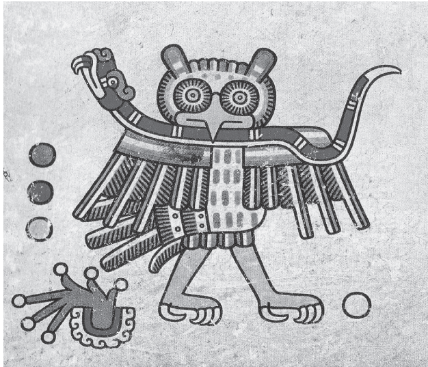
Figura 2.3. Sexo y muerte. Códice Laud , lám. 20