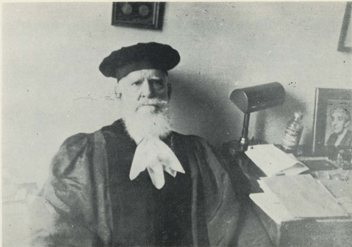
Rafael Altamira con la toga de juez, ciudad de México (1948).

DR© 2017. Universidad Nacional Autónoma de México, Instituto de Investigaciones Históricas