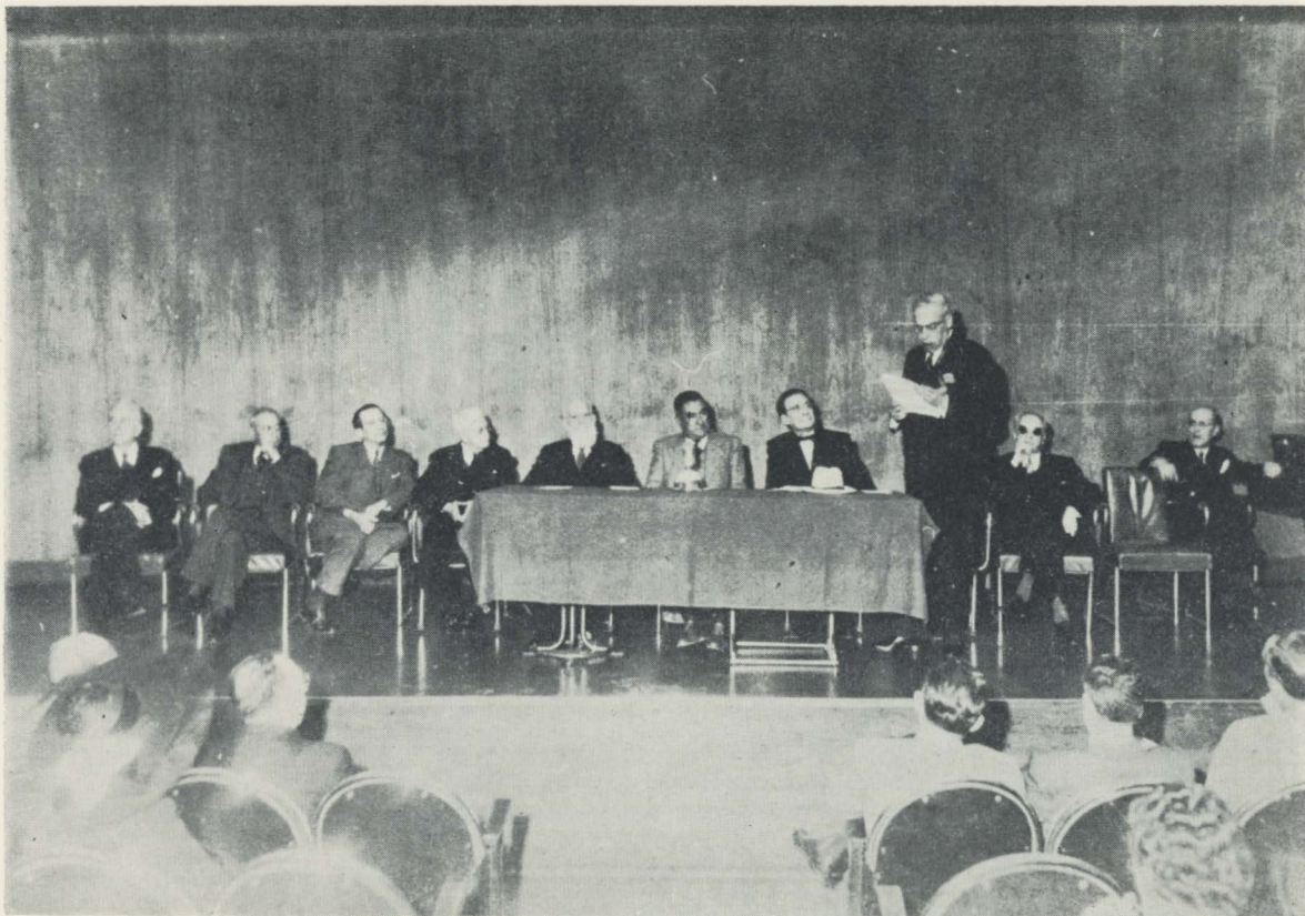
Homenaje a Altamira en el Palacio de Bellas Artes ciudad de México, con motivo de sus ochenta años (1946). DR© 2017. Universidad Nacional Autónoma de México, Instituto de Investigaciones Históricas Disponible en: www.historicas.unam.mx/publicaciones/publicadigital/libros/altamira_crevea/historador.html